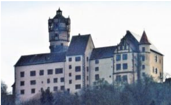
Westseite, Bauzeit 16. Jh