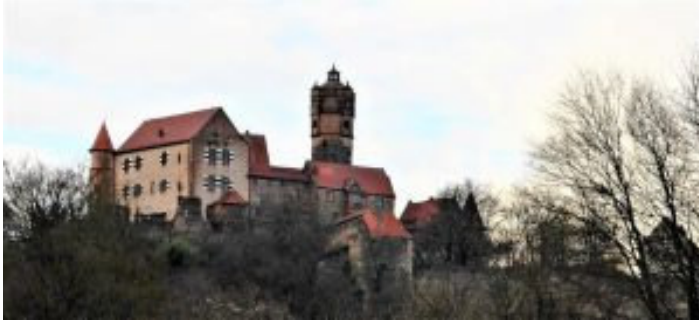
Südseite, Bauzeit 16. Jh