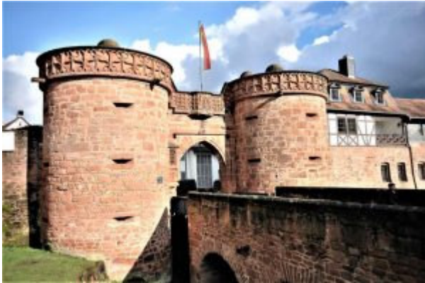
Ansicht des Jerusalemertores, von der Neustadt

Die Doppeltoranlage wurde 1503 im Zuge der Stadtmauer errichtet. Dieses imposante Bauwerk ist auch das Wahrzeichen von Büdingen und verbindet die Vorstadt mit der Altstadt. Nach einer Überlieferung brachte ein Sohn des Grafen, der auf einer Pilgerreise nach Jerusalem war, diesen Entwurf mit.