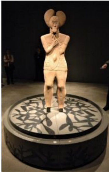
Der Keltenfürst vom Glauberg (ca. 500 v. Chr.)

Ca. 7 km von Büdingen in westlicher Richtung entfernt liegt der Glauberg (Höhe 276 m ü. NN), ein Basaltausläufer des Vogelsberg. Das Plateau mit einer Länge von etwa 800 m und einer Breite von 80 m bis 200 m war eine keltische Siedlung, genutzt vom 6. Jh v. Chr. bis zur Zeitenwende. Bei Ausgrabungen zwischen 1994-1997 wurde ein sehr bedeutender Fund zutage gefördert: die Grabanlage eines Keltenfürsten aus dem 5. Jh vor Chr. und reich ausgestattete Gräber dreier keltischer Krieger, das auf die gehobene Stellung der Verstorbenen hindeutet. Neben den eigentlichen Grabanlagen war die Entdeckung einer Steinfigur eine weitere Sensation. Die bis auf die Füße erhaltene Statue ist mit einer haubenartigen Kopfbedeckung versehen, die als Mistel- Blattkrone gedeutet wird und als Grabbeigabe gefunden wurde. Auf dem Sockelboden ist die Mistel dargestellt. Da die Mistel laut antiker Autoren bei den Kelten eine wichtige kultische Bedeutung besaß, mag das auf die Bestattung eines Priester hinweisen.