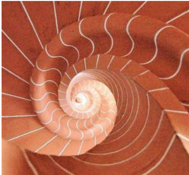
Ein Blick durch das Treppenaug, von unten nach oben

Die Hohlspindeltreppe mit einem gesamten Durchmesser von 368 cm besteht aus Sandstein. Mit 162 cm Laufbreite ist der Aufgang sehr herrschaftlich gewählt. Blickt man durch das Treppenauge von 20 cm, so erkennt man eine Rosette am Treppenabschluss, die an einem Überdeckungsstein montiert ist . Der wandseitige Stufenauftritt liegt bei ~55 cm, der innere Auftritt ist konstant bei 9 cm, der Untertritt beträgt 7 cm. Auf 360 Grad sind 21 Stufen eingeteilt und mit 18,2 cm Steigung lassen sich die 3 Stockwerke mit insgesamt 73 Stufen angenehm bewältigen. Einen Handlauf gibt es erst seit etwa 600 Jahren, zuvor hatten die Menschen die Fähigkeit, Treppen ohne eine Haltevorrichtung zu besteigen. Einen Handlauf gibt es erst seit 600 Jahren. Zuvor hatten die Menschen die Fähigkeit Treppen ohne Haltevorrichtungen zu besteigen. Als Baumeister gelang, Treppen mit Profielen auszuschnücken stellte man fest, dass man sich daran festhalten konnte. Im Bild links befindet sich ein Wulst, der 11 cm in den Raum ragt und eine Gesamthöhe von 9 cm aufweist. Auch im Treppenaug ist ein Wulst von 6 cm.