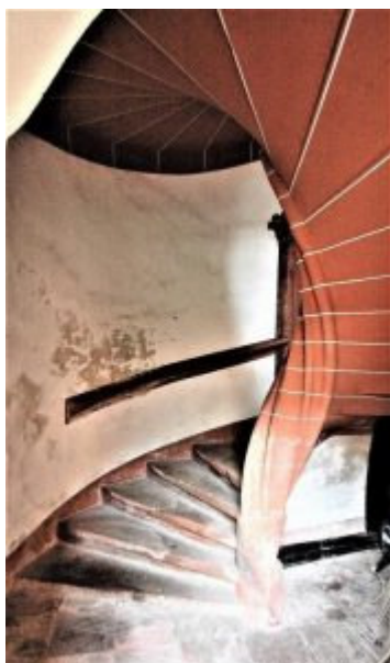
Treppenantritt EG ersten Obergeschoss