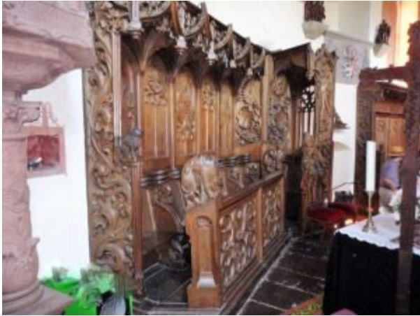
Das Chorgestühl der Schlosskapelle