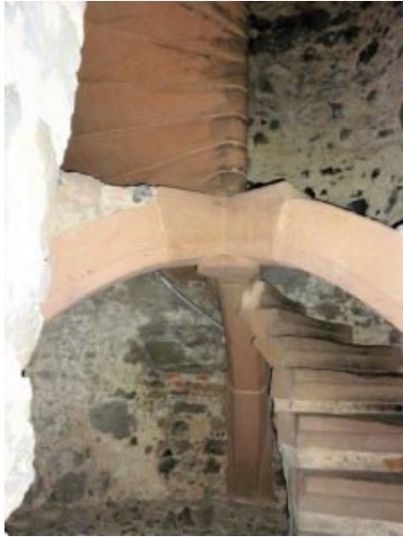
Die Spindeltreppe lastet auf 3 Stützbögen

Der Bergfried, als erstes Bauwerk auf der Anhöhe, war die letzte Zufluchtsstätte der Burgbewohner. Der Eingang lag immer zwischen 3-4 m und war nur mit Leitern zu erreichen. Der untere Bereich war das Verlies. Die Fenster hatte der Heimatverein vor ein paar Jahren eingesetzt. Bevor die Spindeltreppe Ende des 16. Jh eingebaut wurde, war die Turmspitze nur mit Strickleitern erreichbar, die bei Gefahr eingezogen wurden.