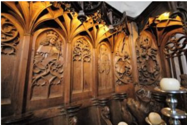
Das Schnitzwerk im Chorgestühl

Graf Ludwig II. ließ zwischen 1495 und 1499 die Schlosskapelle im spätgotischen Stil errichten. Als Glanzstück der Ausstattung hat sich das Chorgestühl aus Eichenholz erhalten, das der Kapelle den Charakter eines kostbaren Schreins verleiht. In seinem Schnitzwerk begegnet uns die fromme und zugleich bizarre Bilderwelt des Spätmittelalters, in der sich Heiligendarstellungen mit verkrümmten Tierleibern, den Sinnbildern dämonischer Kräfte, abwechseln. Zwei Wormser Bildschnitzer haben das Werk 1497-1499 geschaffen.