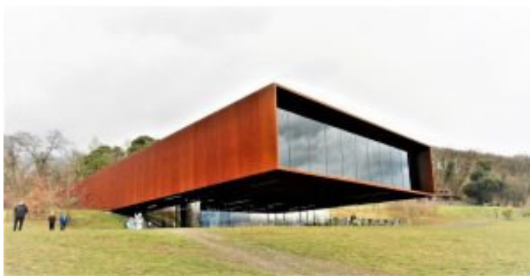
Das Museum mit Forschungszentrum wurde 2011 eröffnet

Auf Grund der bedeutendsten Fundstücke aus den Gräbern, ein goldener Halsreif und eine keltische Schnabelkanne, hat das Land Hessen 2007 den Bau eines Museums in Auftrag gegeben, das am 5. Mai 2011 eröffnet wurde.