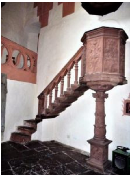
Kanzel mit Kragstufentreppe

Graf Ludwig II. ließ zwischen 1495 und 1499 die Schlosskapelle im spätgotischen Stil errichten. Als Glanzstück der Ausstattung hat sich das Chorgestühl aus Eichenholz erhalten, das der Kapelle den Charakter eines kostbaren Schreins verleiht. In seinem Schnitzwerk begegnet uns die fromme und zugleich bizarre Bilderwelt des Spätmittelalters, in der sich Heiligendarstellungen mit verkrümmten Tierleibern, den Sinnbildern dämonischer Kräfte, abwechseln. Zwei Wormser Bildschnitzer haben das Werk 1497-1499 geschaffen.