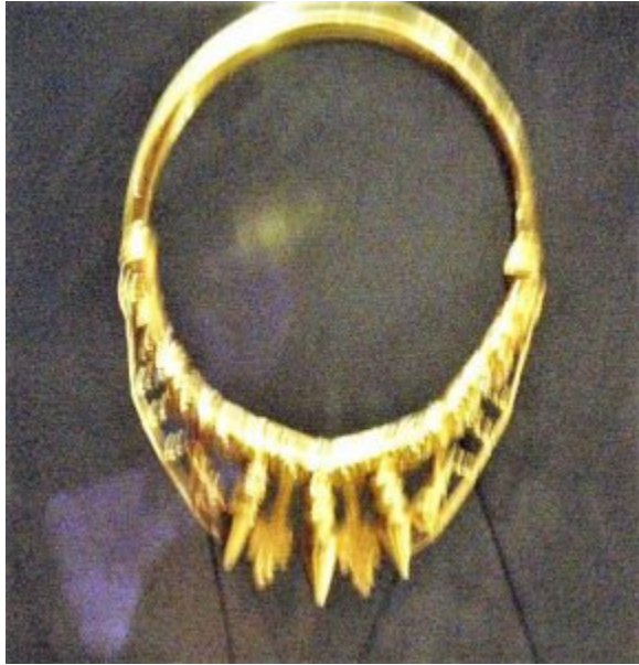
Halsreif in Gold

Das ein Leben auf dieser Hochebene solange möglich war liegt auch an der Wasserversorgung, die durch einen kleinen Weiher erfolgte, der sich durch Oberflächenwasser füllte.