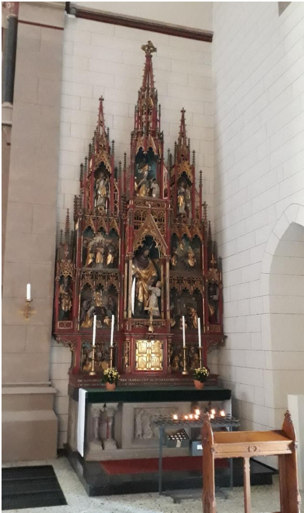
Maria - Zuflucht der Menschen

Maria – Zuflucht der Menschen, im Seitenschiff aus Lindenholz (1967) vom Oberurseler Künstler Hieronimi und die Homburger Pietá. Steinabguss eines Vesperbildes aus dem 14. Jh., das Original (sehr ausdrucksstark und wertvoll) befindet sich als Leihgabe im Diözesanmuseum in Limburg.