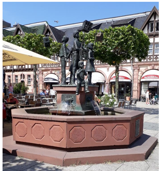
Laternenfest Brunnen, das Laternenfest ist das größte Volksfest das einmal im Jahr stattfindet