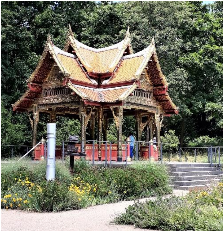
Siamesischer Tempel von 2007

Bad Homburg, die sich in mehrfachen Besuchen von Mitgliedern des thailändischen Königshauses und in jährlichen Gedenkfeiern an der Thai-Sala ausdrücken.