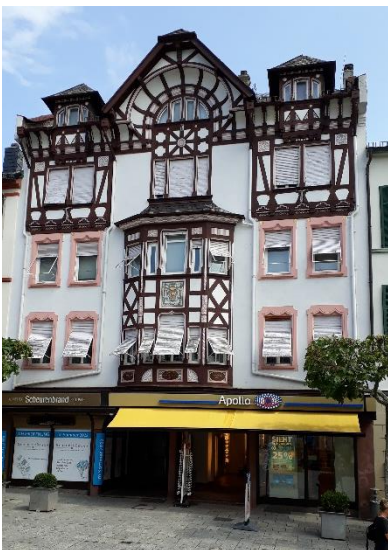
Wohn und Geschäftshaus