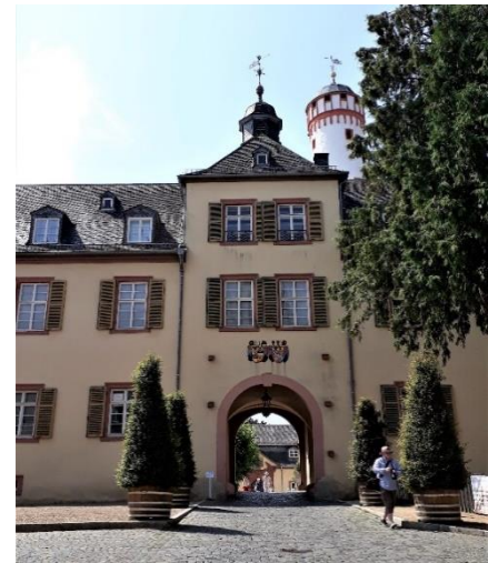
Hirschgangflügel, 1683-1685 unter Einbeziehung des mittelalterlichen Torturms errichtet

Hölderlin gelaufen sein, wenn er seine Geliebte Suzette Gonthard in Frankfurt besuchte. Anfang des 19. Jh. brachte die aus dem britischen Königshaus stammende Landgräfin Elizabeth englisches Flair in den Taunus. Ihre Witwenwohnung in einem Flügel des Schlosses gestaltete sie nach eigenen Vorstellungen im Stil der Zeit. Nachdem Homburg 1866 preu-