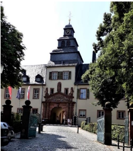
Hauptportal mit herrschaftlichem Wappen

Hölderlin gelaufen sein, wenn er seine Geliebte Suzette Gonthard in Frankfurt besuchte. Anfang des 19. Jh. brachte die aus dem britischen Königshaus stammende Landgräfin Elizabeth englisches Flair in den Taunus. Ihre Witwenwohnung in einem Flügel des Schlosses gestaltete sie nach eigenen Vorstellungen im Stil der Zeit. Nachdem Homburg 1866 preu-