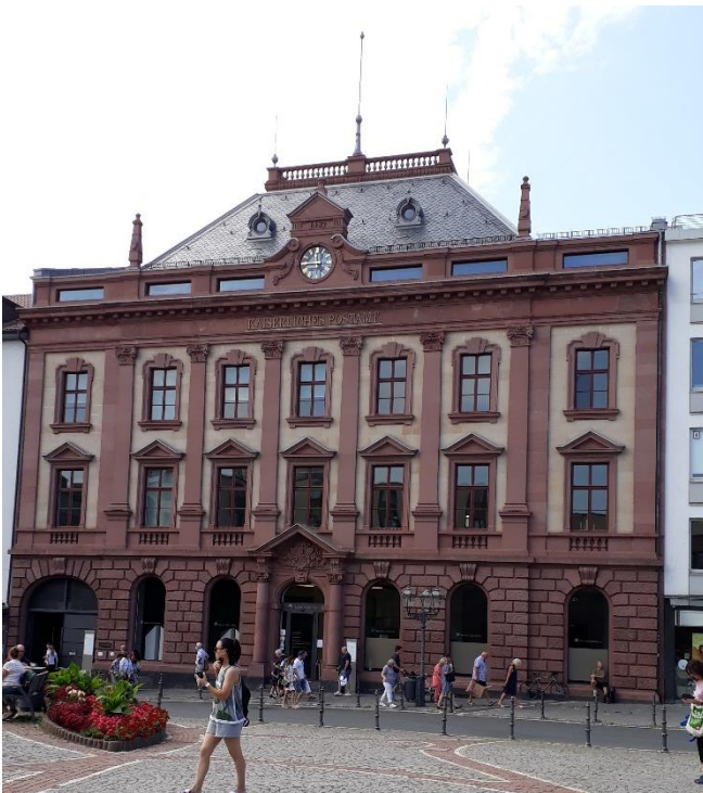
Kaiserliches Postamt, Bauzeit 1893

Die Louisenstraße durchquert die Stadt Bad Homburg mit einer Länge von 1.5 Kilometer. Die Straße beginnt an der Ritter-von Marx-Brücke der Altstadt und führt gerade nach Südosten in Richtung der ehemaligen Frankfurter Chaussee , der Landstraße nach Frankfurt am Main. Als Hauptgeschäftsstraße war die Louisenstraße gleichzeitig auch Standort für die Homburger Banken und Sparkassen auch alle wichtigen Geschäfte haben sich in der Straße niedergelassen. Der längste Teil der Straße ist Fußgängerzone.