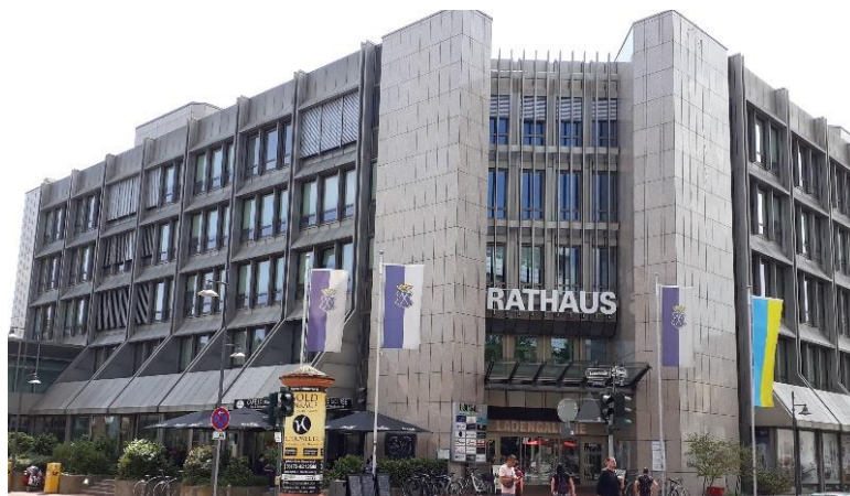
Rathaus erbaut 1981 im Bauhausstil