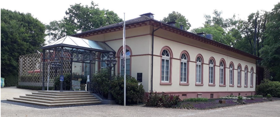
Spielbank im Kurpark, Eröffnung am 23. Mai 1841

Nachdem in den 1820er Jahren mit der Ludwigsquelle die erste Heilquelle in Bad Homburg entdeckt worden war, bestand der Wunsch Bad Homburg auch Kurstadt zu werden. 1830 wurde der Plan gefasst, eine Aktiengesellschaft zum Bau eines Kurparks und Kurhauses zu gründen. Der Darmstädter Architekt Georg Moller legte Pläne vor, die sich an dem repräsentativen Kurhaus von Wiesbaden orientierten. Es konnte jedoch weder die Finanzierung der veranschlagten 100.000 Gulden aufgebracht werden, noch wurde man sich über die Planung einig. Das Projekt scheiterte 1833. 1838/39 wurde im Kurpark das „Brunnensälchen“ als „Kursaal“ für gesellige Veranstaltungen errichtet. Landgraf Ludwig von Hessen-Homburg, auch Gouverneur von Luxemburg, macht die Bekanntschaft mit den Zwillingenbrüder Francois und Louis Blanc, die dort ein Kasino betrieben. Am 19. Juli 1840 wurde ein Vertrag zwischen dem Landgrafen und den Brüdern Blanc geschlossen, der den Blancs eine Konzession über 30 Jahre zum Betrieb einer Spielbank in Bad Homburg zusicherte. Im Gegenzug wurde eine steigende Pacht vereinbart, die am Ende 10.000 Gulden pro Jahr erreichen sollte. Außerdem mussten die Gebrüder Blanc das Kurhaus für mindestens 100.000 Gulden errichten und dem Landgrafen übereignen, der seine Finanznot minderte.