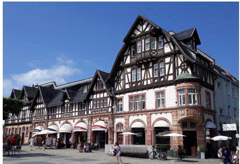
Marktplatz, Gebäude im Historismus