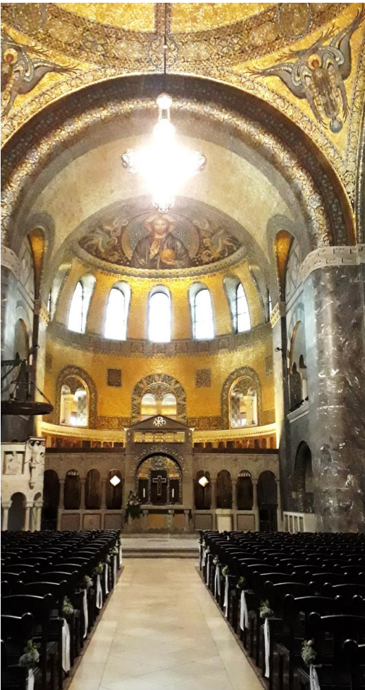
Ansicht zum Altarbereich mit "Lettner" und Kanzel

Der Innenraum ist nicht längsgerichtet, er ist kreuzförmig angelegt, dessen vier Kreuzarme nahezu gleichlang sind. Nur der Kreuzarm zum Altarbereich ist durch eine mächtige Apsis halbrund ausgeführt, alle anderen sind gerade geschlossen. Die Mitte des Raumes wird von einem mächtigen Kuppelgewölbe beherrscht, das auf vier Eckpfeilern aufsitzt. Zu beiden Seiten der Vierung ruhen flach ansteigende Emporen auf kurzen, fast stummelhafte Säulen. Eine dritte Empore bemerkt man erst beim Blick zum Eingang, denn sie befindet sich über der Vorhalle; sie enthält den großen Orgelprospekt. Der Kreuzraum mit dem Altar schließlich wird durch eine Pfeilerstellung unterteilt, so dass hinter dieser direkt unter dem Apsismosaik ein eigener Raum entsteht. Sämtliche genannten Einbauten sind bezogen auf die gesamte Raumhöhe, so niedrig angebracht, dass der Besucher den Eindruck eines einzigen riesigen Raumes hat. Natürliches Licht, durch Grisaillefenster gemildert, dringt durch zwei große Rosenfenster über beiden Seitenemporen,