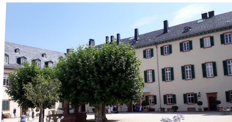
Innenhof des Schlossbereiches >

ßisch geworden war, nutzte besonders das letzte deutsche Kaiserpaar, Wilhelm II. (1859-1941) und Auguste Victoria, das Schloss als eine bevorzugte Sommerresidenz, auch in Kriegszeiten. Ihre Apartments im Königsflügel sind das einzige in Deutschland erhaltene Beispiel für die Wohnkultur des Kaiserhauses.