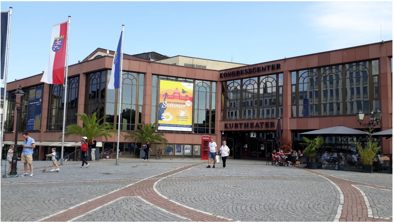
Kongresscenter im Kurhaus