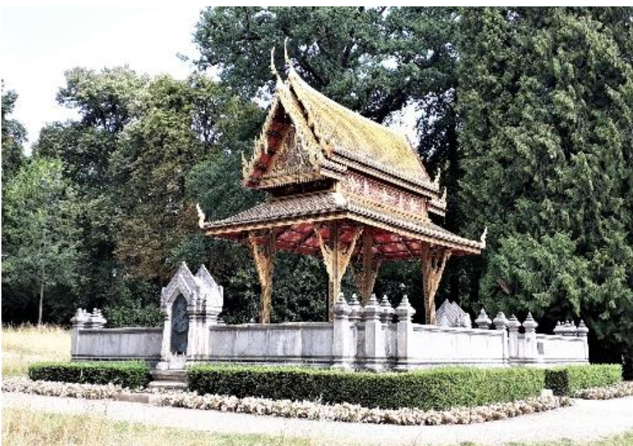
Siamesischer Tempel von 1907

Mit seinem Geschenk legte er den Grundstein für die besonders enge Beziehung zwischen Thailand und