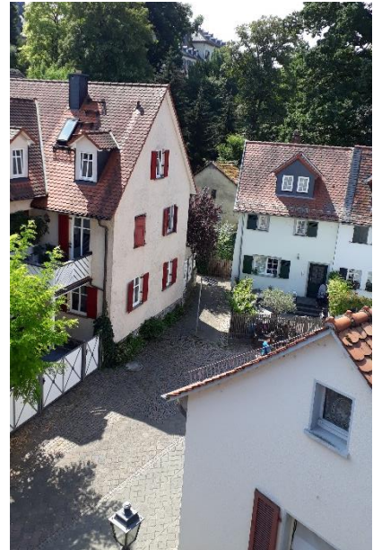
Blick in die Altstadt von Bad Homburg

Die Louisenstraße durchquert die Stadt Bad Homburg mit einer Länge von 1.5 Kilometer. Die Straße beginnt an der Ritter-von Marx-Brücke der Altstadt und führt gerade nach Südosten in Richtung der ehemaligen Frankfurter Chaussee , der Landstraße nach Frankfurt am Main. Als Hauptgeschäftsstraße war die Louisenstraße gleichzeitig auch Standort für die Homburger Banken und Sparkassen auch alle wichtigen Geschäfte haben sich in der Straße niedergelassen. Der längste Teil der Straße ist Fußgängerzone.