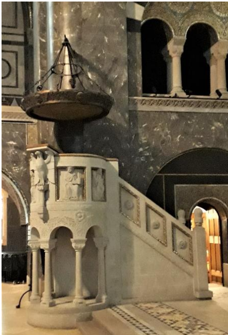
Kanzel der Erlöserkirche

durch dichte Fensterreihen im Erdgeschoss und durch zwei Reihen von Fenstern am Fuß der Apsis ein. Die künstliche Beleuchtung wird durch eine Anzahl kleiner Leuchten vor allem durch einen monumentalen kreuzförmigen Leuchter, der aus der Mitte der Kuppel herabhängt, erzeugt. Die Raumgestalt wurde wesentlich vom Architekten Franz Schwechten bestimmt, die die plastischen Kunstwerke wie Altarschranken, Kapitellschmuck und Kanzel stammen von Gotthold Rieglmann und der Mosaikschmuck von Hermann Schaper.