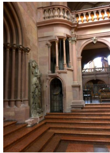
Die Erste mir bekannte Spindeltreppe mit aufgelöster Außenwandung und gefalteten Stufenkanten

Dieses Werk wurde knapp 300 Jahre zuvor erstellt.