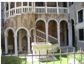
Der Treppenturm ist nicht im Stil der Zeit, aber schön.

La Scala Contarini „del Bovolo“ Der wohlhabende Bauherr, Contarini del Bovolo (25 Bauwerke konnte er sein Eigen nennen) hatte 1499 die Idee, einen neuen Treppenaufgang an ein bestehendes Gebäude zu bauen. Ein Turm mit einer Spindeltreppe war die Lösung in den engen Verhältnissen von Venedig. Es ist nicht bekannt, ob der Baumeister Giovanni Candi vom Zeitgeist getrieben oder aus Platzgründen eine Spindeltreppe baute, die er letztlich in den Details auf das Feinste ausarbeitete.