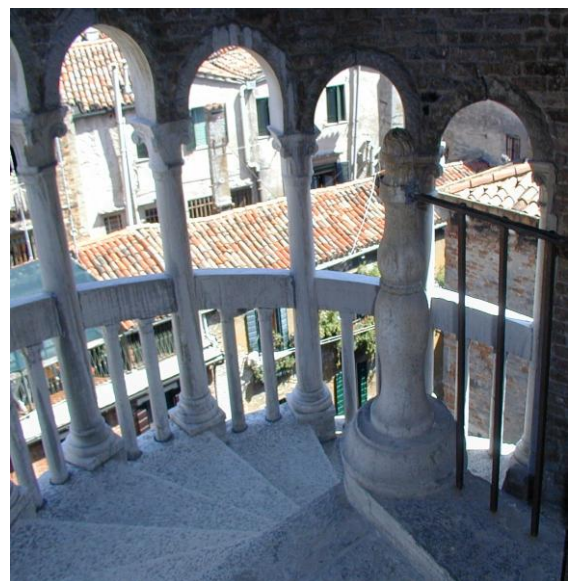
Der Austritt des obersten Treppenlaufes