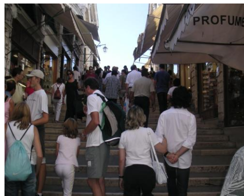
Die Mittlere Treppe. Die Treppe lässt sich mühelos aufsteigen, bei den Podesten macht der Nutzer 3 Schritte. Beim Absteigen überwindet der Nutzer mit 2 Schritten das Podest, allerdings sind die Auftritte der Stufen zu kurz