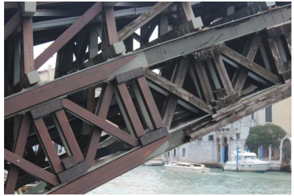
Das Holz ist einem ständigen Fäulnisprozess ausgesetzt.

Die Maße und Bilder wurden von Ruth+Dieter Wolff Frankfurt M. 2014 auf genommen.