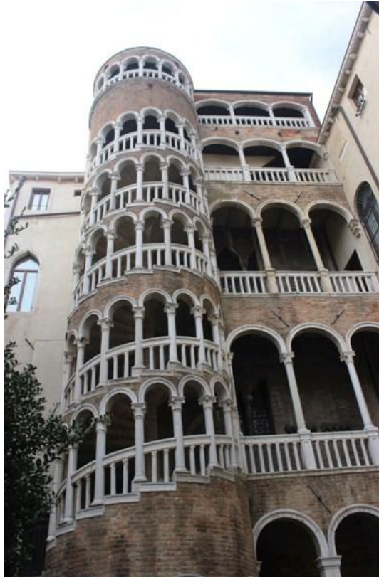
Das gehobene Bürgertum nahm sich als Symbol der Herrschaft das Recht ihren Treppenturm höher bauen zu dürfen als die benachbarten Gebäude.

Dieser Treppenturm wurde dem bestehenden Palast nachträglich angefügt. Infolge des milden Klimas stellte die Auflösung der Außenwände kein Problem dar. Durch diesen offenen Charakter hinterlässt die Bauart dieser Anlage eine leichte und kühne Form. Die Säulen mit ihren halbkreisförmigen Bögen sind untereinander verbunden und leiten die Last nach unten ab, die Säulen stehen linear übereinander. Durch die unterschiedlichen Geschoßhöhen konnte keine gleichmäßige Symmetrie zu den Stufenvorderkanten hergestellt werden. Der Handlauf sowie die Docken sind mit ihrer Dimension und ihren Profilen ähnlich derer an anderen Gebäuden. Allerdings wurde nur das Geländer der Loggien bei der Erstellung der Treppenanlage hergestellt - dies ist zu erkennen an den Säulenanschlüssen. Das restliche Geländer wurde zu einem späteren Zeitpunkt eingebaut, dies ist auch an den unsauberen Anschlüssen der Handläufe an die Säulen zu erkennen. Ein Loggienbau stellt die Verbindung zum Palast her. Der Treppenturm ragt um ein Geschoß über das Gebäude und auch über die Nachbargebäude hinaus. Dieses Haus wurde im 19. Jhd. als Hotel genutzt, die Gäste hatten am Treppenaustritt einen Panoramablick über die Dächer von Venedig.