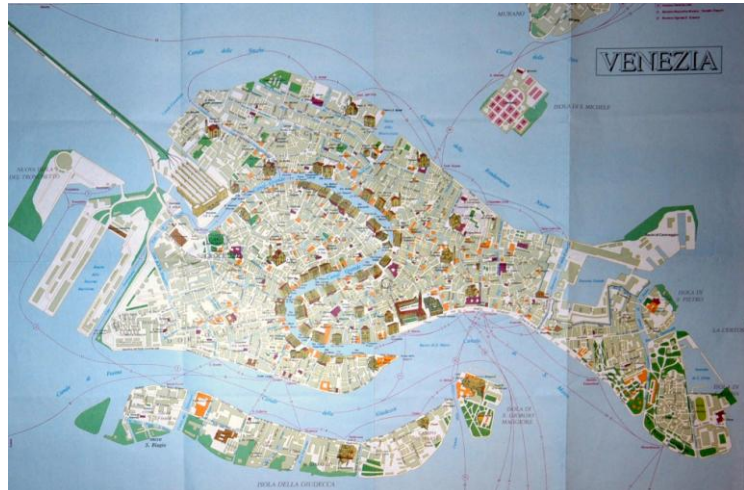
Die Kernstadt Venedig. Der Canal Grande Bild Mitte, verläuft in einer S Form vom Bahnhof zum Dogenpalast.

Lagunenflüchtlinge rivus altus (Hohes Ufer) nannten, gründeten sie eine größere Siedlung – die spätere Metropole Venedig. Um den Häusern, die aus Holz bestanden, ein festes Fundament zu geben wurden Millionen angespitzter Holzpfähle – 2 Meter lang 15 cm dick – in den Schlick und den darunter liegenden festen Lehmboden gerammt. Nach dem verheerenden Stadtbrand von 1105 wurde zunehmend in Stein gebaut.