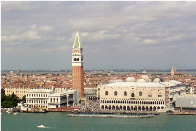
Links Campanile, ca. 100 m hoch, rechts Dogenpalast, dazwischen Markusplatz. Hinter dem Dogenpalast sieht man die Kuppeln der Markuskirche.

Der Dogenpalast war seit dem 9. Jahrhundert Sitz des Dogen von Venedig und der