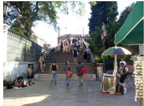
Der Treppenantritt von der San Marco Seite.

Konstruktion im Rahmen einer Sanierung materiell umfassend ein zweites Mal erneuert. Eine weitere Reparatur wird 2014 vorgenommen.