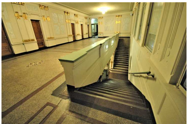
Ansicht, 2. OG mit den gegenläufigen Austrittsarmen