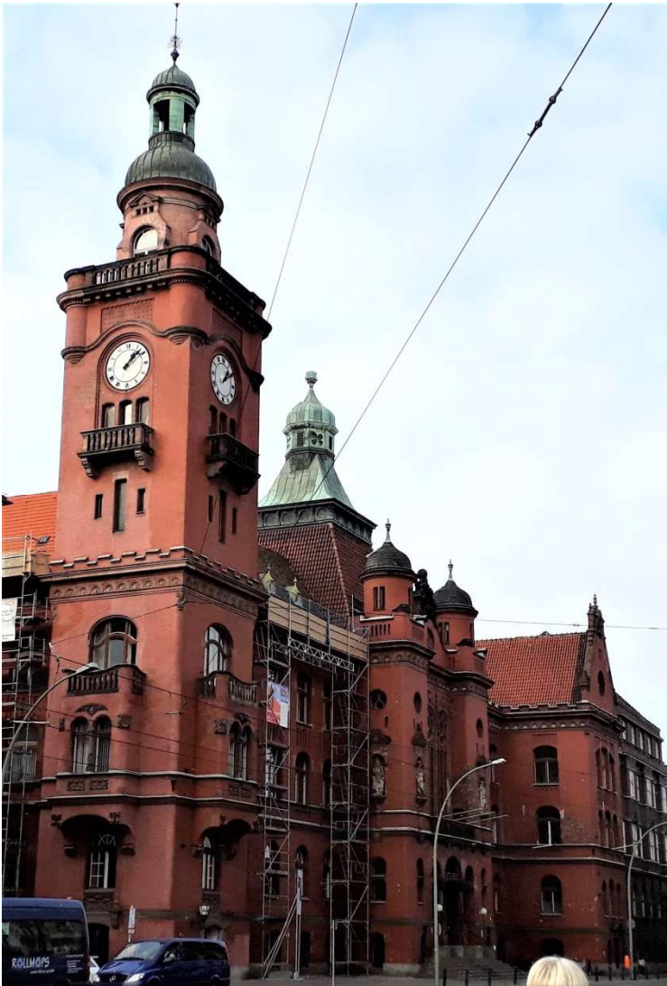
Das Rathaus zeigt eine Mischung unterschiedlicher Stilformen

Der 1901 – 1903 errichtete monumentale Klinkerbau für das Rathaus an der Breiten Straße ist eine Mischung verschiedener Baustiele, wie sie typisch waren zu Beginn des 20. Jh., Elementen der Neugotik, des Neubarocks und des damals modernen Jugendstils.