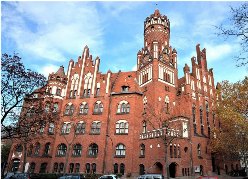
Viele Schmuckelemente zieren das Rathaus. Rechts, hinter den doppelgeschossigen Renaissancefenstern befindet sich der Ratssaal

Schmargendorf, das Ehemalige Bauerndorf am Rand des Grunewaldes hat sich zum Ende des 19. Jh. zu einem Vorort Berlins entwickelt. 1883 erhielt Schmargendorf eine eigene Haltestelle der Berliner Ringbahn (Bf Schmargendorf) und 1899 wurde der Ort im Landkreis Teltow zum selbstständigen Amtsbezirk ernannt. Bis zu dieser Zeit tagte die Gemeindeverwaltung in einem kleinen Bauernhaus an der Breiten Straße. Die durch die Umsatzsteuer aus Landverkäufen der ansässigen Bauern reich gewordene Gemeinde, beschloss im Jahre 1900 den Bau eines repräsentativen Rathauses. Nach Plänen des Potsdamer Architekten und Bauunternehmers Otto Kerwien, der zuvor das Babelsberger Rathaus fertiggestellt hatte, sollte auf einem außerhalb des Siedlungsgebietes gelegenen 2000 qm großen Grundstück