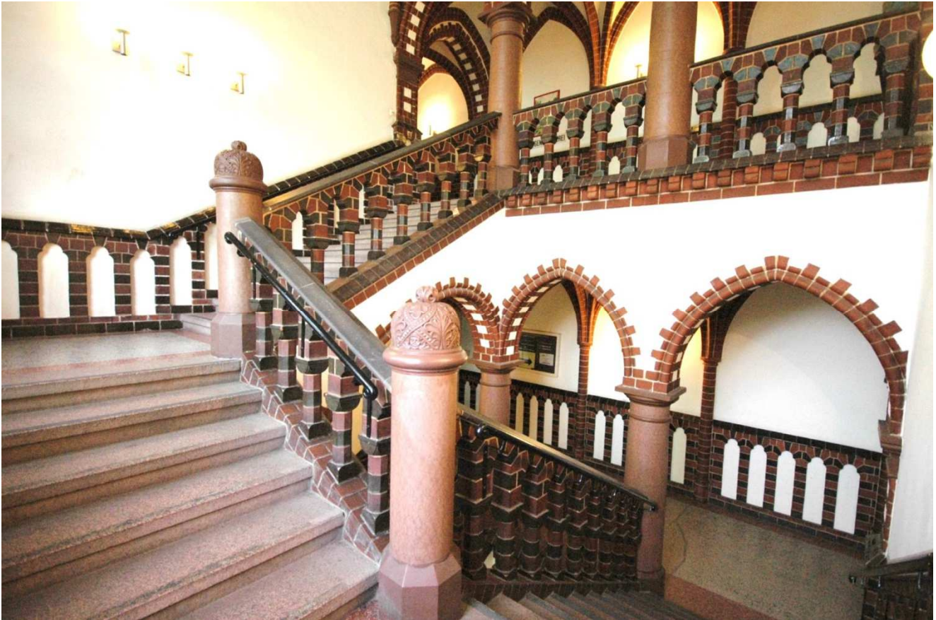
Ein blick auf die Treppe vom ersten ins zweite Obergeschoß

der den 20 cm breiten Granithandlauf trägt. Die Ecksäulen bestehen aus Granit, der Schaft hat einen Ø vom 30 cm, die eckigen Sockel haben eine Dicke von 38 cm. Ein Knauf bildet den Übergang zur kugelähnliche Bekrönung, der vegetabilische ausgebildet ist. In ein überkreuz gelegtes Schleifenband sind Palmettmotive und unterschiedlich gestaltete Masken eingearbeitet. Die Wandlamperie hat eine ähnliche Bekleidung wie das Geländer. Die dunkelgrünen Backsteine im Geländer sind glasiert.