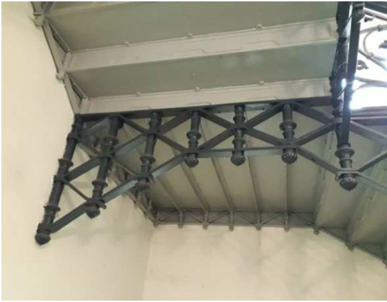
Treppenunteransicht mit der Tragkonstruktion des dritten Treppenarmes und der Stufenunterkonstruktion aus Blech, die dem Brandschutz dient