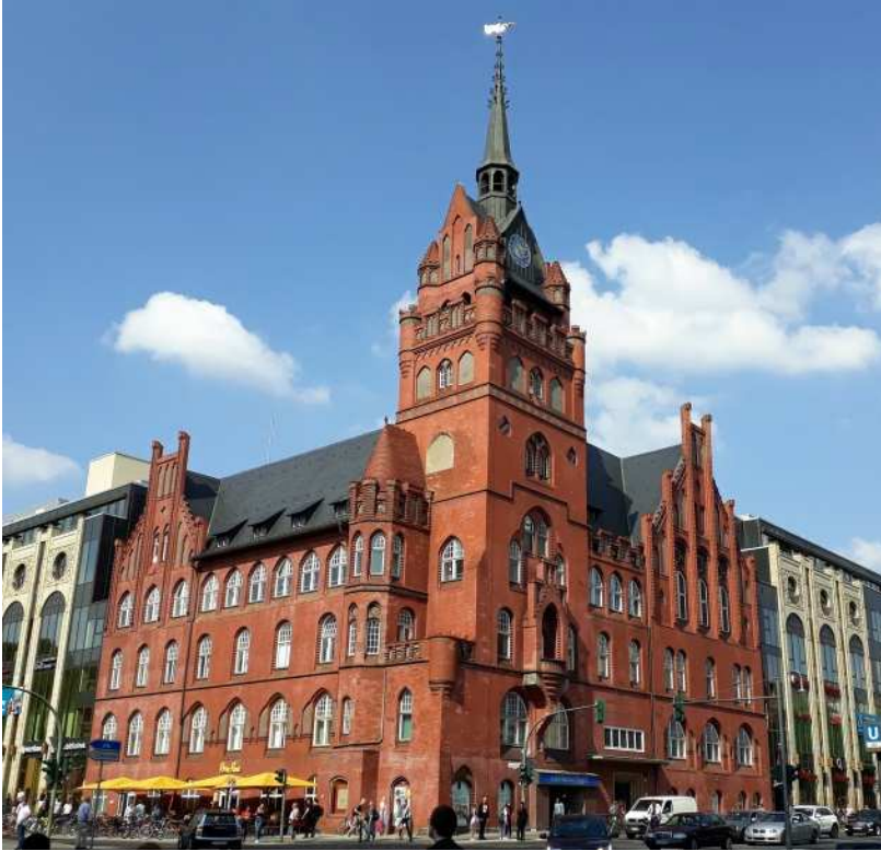
Rathaus Steglitz im neogotischen Baustil an der Kreuzung Schlossstraße/Grunewaldstraße bildet mit seinem mächtigen Eckturm lange die Dominante im Zentrum von Steglitz

mächtigen gestaffelten Turm mit Eckbastionen, Altanen, Erkern und Balkonen geprägt, der noch immer über seinen ursprünglichen Dachreiter verfügt. Die beiden Schauffassaden zeigen eindrucksvolle Staffelgiebel mit Krabben, Wimpergen, (gotische Ziergiebel) und Spitzbogenblenden. Im heute weiß getünchten Inneren mit Netzgewölben haben sich aufwändige gusseiserne Treppenläufe erhalten. Der Bau wurde von der zeitgenössischen Kritik gelobt.