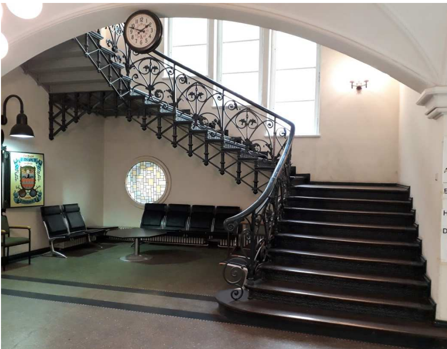
Treppenaufgang in der Eingangshalle

mächtigen gestaffelten Turm mit Eckbastionen, Altanen, Erkern und Balkonen geprägt, der noch immer über seinen ursprünglichen Dachreiter verfügt. Die beiden Schauffassaden zeigen eindrucksvolle Staffelgiebel mit Krabben, Wimpergen, (gotische Ziergiebel) und Spitzbogenblenden. Im heute weiß getünchten Inneren mit Netzgewölben haben sich aufwändige gusseiserne Treppenläufe erhalten. Der Bau wurde von der zeitgenössischen Kritik gelobt.