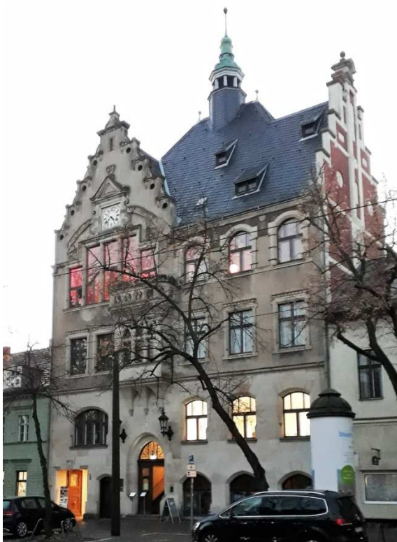
Rathaus an der Friedrichshagener Hauptstraße, Bölschestraße 87

Die Vorgeschichte zum Rathaus: Das Gemeindeamt und Standesamt waren in einem angemieteten Gebäude untergebracht. Der ortsansässiger Schriftsteller Bruno Wille schilderte die Nöte der Verwaltung. „Längs der Wände lagen die Akten aufgestapelt, in den Fächern hölzerner Gestelle ohne Verschluss, dem Staube der Vergilbung, den Motten preisgegeben. Ein paar Schreibseelen hockten an Pulten, und wenn sie nicht frühstückten, rauchten oder plauderten, hörte man ihre Feder kritzeln, dazu im Sommer den ländlichen Fliegenschwarm summen und beim Nachbarn die Hühner gackeln.“