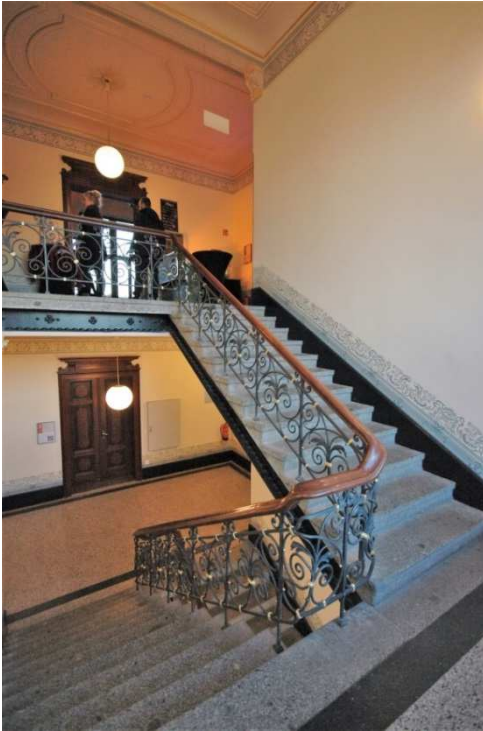
Gegenläufige Treppe mit Wendepodest