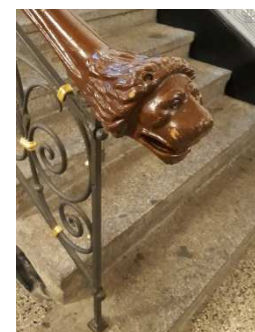
Handlauf, am Antritt im EG