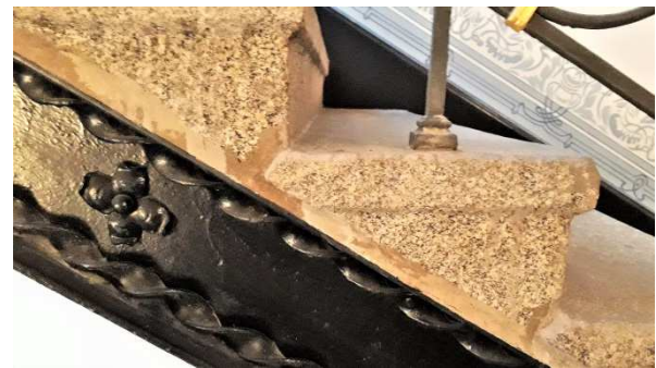
Granitstufen mit Untertritt und dem Versatz zur nächsten Stufe. Die Eisenträger mit Zierkordel und Zierrosette