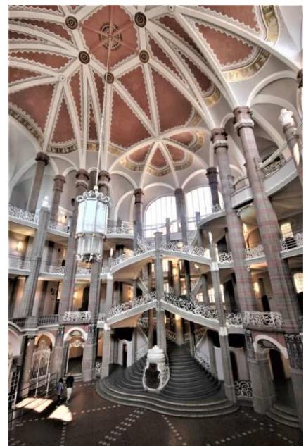
Die Struktur des 28 m hohen Saals mit den verschlungenen Treppenläufen ist von verwirrender Komplexität

Die Eingangshalle zum Landgericht Berlin in der Littkenstraße kann durchaus als „königlich“ bezeichnet werden. Nach den Plänen von Otto Schmalz wurde das Gebäude in den Jahren von 1895-1905 erbaut. Schmalz ist es auf bewundernswerter Weise gelungen die unterschiedlichen Treppenwindungen zu einer Einheit zu führen. Bedingt auch noch durch die