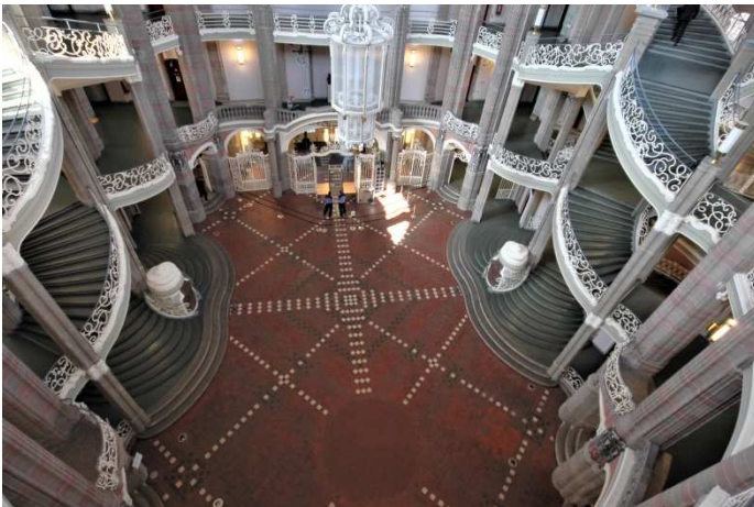
Die monumentale Eingangshalle verbindet die Elemente von Neugotik, Neubarock und Jugendstil