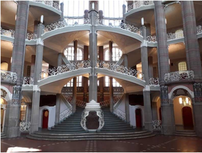
Die Steigung der Stufen beträgt 16 cm, das 1. Stockwerk hat 32 Stufen, das 2. Stockwerk 30 Stufen, nach 14 Stufen befindet sich ein Podest

großräumiger Eindruck erzielt. Die Treppen sollen hier die Würde des Gerichtes unterstreichen und die in ihm zum Ausdruck gebrachte Macht des Staates demonstrieren. Sie sind imposant durch die in überquellenden Formen sich entladende Phantasie und durch die kunstvolle Führung der Aufgänge. Schmalz ist es hier gelungen, was in dem von ihm als vorbildlich empfundenen Barock nur selten versucht worden ist: die Repräsentanz einer Haupttreppe auf mehrere Geschosse gleichmäßig zu verteilen.