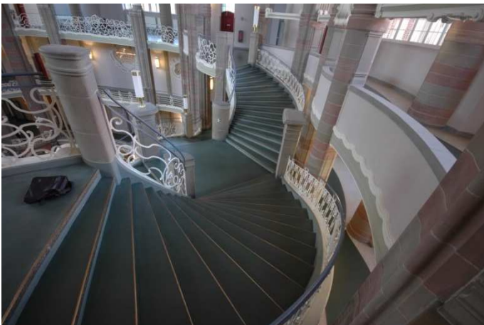
Die Treppen in Beton sind so geformt, dass die Zwischenpodeste ein Quadrat ergeben

großräumiger Eindruck erzielt. Die Treppen sollen hier die Würde des Gerichtes unterstreichen und die in ihm zum Ausdruck gebrachte Macht des Staates demonstrieren. Sie sind imposant durch die in überquellenden Formen sich entladende Phantasie und durch die kunstvolle Führung der Aufgänge. Schmalz ist es hier gelungen, was in dem von ihm als vorbildlich empfundenen Barock nur selten versucht worden ist: die Repräsentanz einer Haupttreppe auf mehrere Geschosse gleichmäßig zu verteilen.