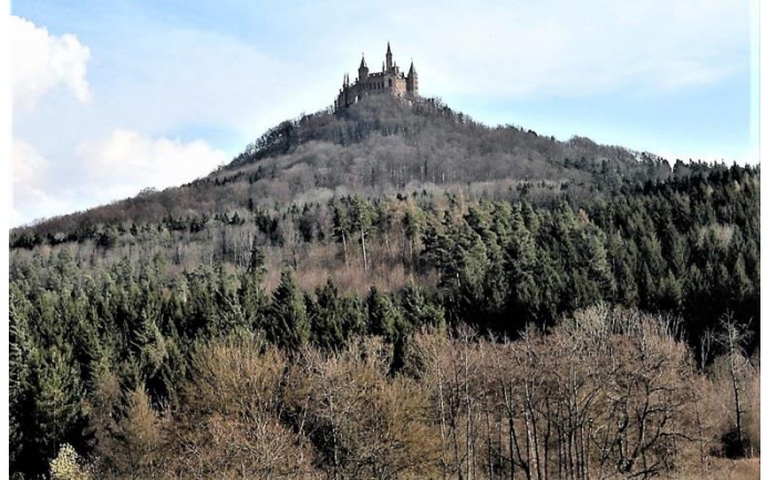
Burg Hohenzollern, Baden - Württemberg

Die erste Burg wurde vermutlich im 11. Jh. erbaut und 1267 erstmals urkundlich erwähnt. Sie wurde durch Kriege häufig zerstört, wieder aufgebaut, im 30-jährigen Krieg von den Schweden belagert und 1744 von den Franzosen besetzt. Danach verlor die Burg ihre militärische Bedeutung. Infolge der Revolution fielen 1850 die Stammlande der Hohenzollern Dynastie an Preußen.