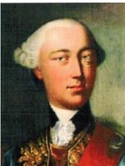
Karl Alexander 1736-1806 (reg. 1757-1791)

Eine schillernde Herrschergestalt war Karl Wilhelm Friedrich von Brandenburg-Ansbach (reg 1729-1757), auch „wilder Markgraf“ genannt. Der bereits als 17jähriger zur Regierung gekommene Karl war mit der 14jährigen preußischen Prinzessin Friederike Luise (eine Schwester Friedrich des Großen) verheiratet. Während seiner Regentschaft häufte er durch rege Bautätigkeiten und großzügigem Lebensstil einen Schuldenberg von 5 Millionen Gulden an. Zugleich förderte er aber auch die Kunst und Wissenschaft, so wie Industrie und Gewerbe. Mit 45 Jahren verstarb er an den Folgen eines Schlaganfalls in Gunzenhausen.