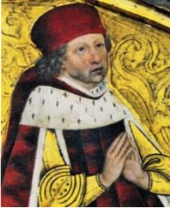
Albrecht Achilles (reg. 1440-1485)

Der Enkel des Nürnberger Burggrafen Friedrich V. und Sohn des Kurfürsten Friedrich I. von Brandenburg Markgraf Albrecht Achilles (reg 1440-1486) erbe von seinem Vater das Fürstentum Ansbach. Nach dem Tod seines Bruders Johann erbe er auch das Fürstentum Kulmbach und nach Abdankung seines älteren Bruders Friedrich II. auch noch die Markgrafschaft Brandenburg. Albrechts Hofhaltung, u.a. glanzvolle Turniere, machten Ansbach im 15. Jh. zu einem Ort, in dem Reichspolitik gestaltet wurde und Kaiser und Könige ein- und ausgingen.