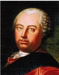
Carl Wilhelm Friedrich (reg. 1729-1757)

Als neuer Herrscher kam gemäß des brandenburgischen Hausgesetzes „Dispositio Acheillea“ (testamentarische Festlegung der Erbfolge von 1473 des Markgrafen Albrecht Achilles) Joachim Ernst von Brandenburg-Ansbach (reg 1603-1625) aus „cölln an der Spree“ nach Ansbach. Er begründete die jüngere Linie der fränkischen Hohenzollern.