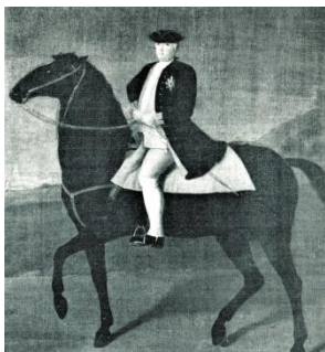
Friedrich Wilhelm I. (1688-1740 reg, ab 1713)

Kurfürst Friedrich III. (1657-1713) von Brandenburg wurde, nachdem er Kaiser Leopold I. politische und militärische Unterstützung zugesagt hatte, die Annahme eines Königstitels erlaubt. Da allerdings Preußen zu diesem Zeitpunkt noch zu einem kleinen Teil Polen angehörte, konnte sich Friedrich und seine Nachfolger nur „Könige in Preußen“ nennen. Am 18. Januar 1701 krönte sich der Kurfürst in Königsberg zum König Friedrich I. in Preußen . Dem barocken Zeitgeist entsprechend war er liberal gesonnen, schätzte eine repräsentative Hofhaltung und widmete sich der Kunst und Kultur.