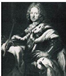
König Friedrich I. in Preußen (ab 1701)

1685 gewährt Friedrich Wilhelm den protestantischen Religionsflüchtlingen aus Frankreich, den Hugenotten, Asyl. Ebenso aus Wien vertriebenen Juden und Lutheranern aus Salzburg und Böhmen. Die Zugezogenen schätzten die religiöse Toleranz und trugen erheblich zum Wirtschaftsaufschwung bei.