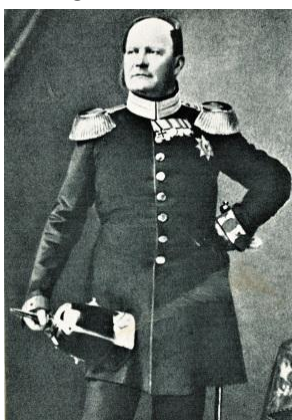
König Friedrich Wilhelm IV. (1795-1861 reg. 1840-1858)

König Friedrich Wilhelm IV. wuchs mit seinen Geschwistern gut behütet in einem intakten familiären Umfeld auf. Der