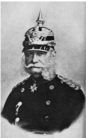
König Wilhelm I. (1797-1888 reg. 1861-1888)

Friedrich Wilhelm, ein künstlerisch veranlagter Monarch, war tief religiös und hatte großes Interesse an gotischer Architektur und Romantik. U.a. ließ er das Orangerieschloss in Potsdam und das Neue Museum in Berlin bauen und veranlasste 1842 den Wiederaufbau des Kölner Doms. Dieser war damals mit seinen 156 m hohen Türmen das höchste Bauwerk der Welt und eine der größten Kirchen der Christenheit.