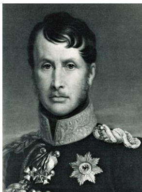
König Friedrich Wilhelm III. (1770-1840 reg. ab 1797)

Mit den sinnesfreudigen Vergnügungen am Hof seines Vaters konnte Friedrich Wilhelm III. nicht viel anfangen. Er galt als wortkarg und oftmals unentschlossen. Durch seine Heirat mit der schönen, liebenswürdigen und charmanten Prinzessin Luise zu Mecklenburg-Strelitz im Jahre 1793 gewann das Königshaus viel an Popularität. Aus der Ehe mit Luise gingen 10 Kinder hervor, darunter der spätere König Friedrich Wilhelm IV. (1795-1861) und König und Kaiser Wilhelm I. (1797-1888).