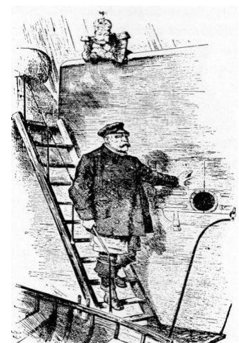
Der Lotze verlässt das Schiff (kommentierte eine Englische Zeitung)

Als Wilhelm mit 29 Jahren den Thron bestieg behaupteten Kritiker, dass er für dieses hohe Amt nicht ausreichend ausgebildet sei. Am Tag nach der Krönung verließ seine Mutter, die nie ein gutes Verhältnis zu ihrem Sohn hatte, das Neue Palais und übersiedelte nach Kronberg im Taunus und nannte sich nun „Kaiserin Friedrich“.