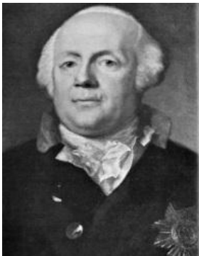
Friedrich Wilhelm II. (1744-1797 reg. ab 1786)

Bei der ersten polnischen Teilung 1772 erhielt Friedrich der Große, große Teil Westpreußens und konnte sich nun König von Preußen nennen. 1786 verstarb er. Nach langer Odyssee konnten die sterblichen Überreste des „Alten Fritz“ 1991 endlich in seiner schon zu Lebzeiten angelegten Gruft auf der Terrasse von Sanssouci bestattet werden.