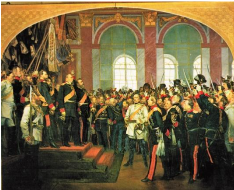
Kaiserproklamation in Versailles am 18. Januar 1871

Die spanische Thronfolgefrage war der Anlass zum Deutsch-Französischem Krieg. Bismarck verkürzte die „Emser Depesche“ so, dass sie Frankreich beleidigt. Kaiser Napoleon III. erklärt Preußen den Krieg. König Wilhelm zog an der Spitze der seit 1867 verbündeten deutschen Staaten in den Krieg. Im Felde war der König nicht nur nomineller Oberkommandierender, sondern beriet mit großem Sachverstand alle Entscheidungen, wobei er sich gewöhnlich den Ausführungen dem Chef des Generalstabes von Moltke anschloss. Elsass und Lothringen wurden wieder dem Deutschen Reich angegliedert.