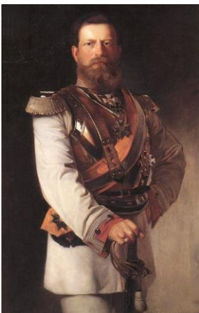
Kaiser Friedrich III. (1831-1888) reg. 99 Tage

Regierungszeit: 09.03.1888-15.06.1888 (99 Tage)