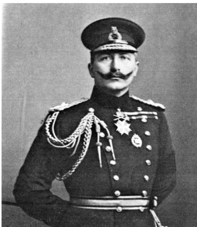
Kaiser Wilhelm II. (1859-1941 reg. 1888-1918)

Aufgrund der langen Kronprinzenzeit förderte das Paar Museen, Kunst und setzte sich intensiv für soziale Einrichtungen ein.