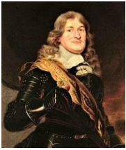
Friedrich Wilhelm "der Große Kurfürst"

Im Dreißigjährigen Krieg verwüsteten schwedische, dänische und kaiserliche Truppen immer wieder die Mark Brandenburg. 1640 übernahm Friedrich Wilhelm (1620-1688), genannt „der Große Kurfürst“, im Jahre 1640 die Herrschaft über Brandenburg und auch über Preußen. Er zentralisierte die Verwaltung und führte ein aus Berufssoldaten bestehendes Heer ein. Im Westfälischen Frieden wurde Brandenburg mit Hinterpommern zugesprochen und auch Magdeburg kam später dazu. In der Schlacht von Fehrbellin 1675 besiegte die Armee des Kurfürsten die einfallenden Schweden. Militärisch war dieser Erfolg nur von geringer Bedeutung, trug aber zum Prestigegewinn der brandenburgisch-preußischen Armee bei.