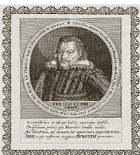
Johann Sigismund (1572-1619 reg. ab1608)

Im Jahre 1614, unter Kurfürst Johann Sigismund, fielen die Herrschaftsgebiete Kleve, Mark, Ravensberg und das Herzogtum Preußen an Brandenburg, wodurch sich nicht nur weitere territoriale Verlagerungen ergaben, sondern sich auch im Besitz eines einzigen Hohenzollers befanden. Durch die Heirat mit Anna von Preußen und den Tod seines Schwiegervaters erbte er Preußen. Die Territorien lagen teils innerhalb und teils außerhalb des Römischen Reiches Deutscher Nation.