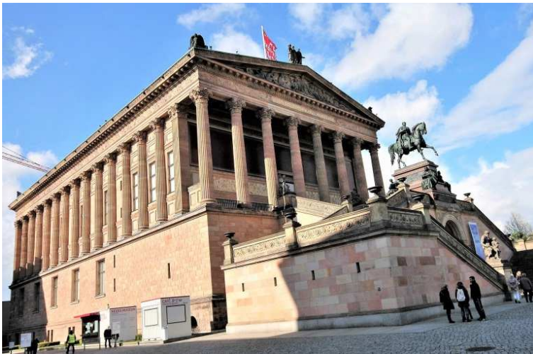
Die Alte Nationalgalerie von Stüler und Strack 1876 vollendet, ist eine vom Stil, spätklassizistischer Nachzügler der Schinkel-Schule

Ein Jahr nach dem Tod Friedrich II. von Preußen beschloss die Berliner Akademie, dem König ein Denkmal zu setzen. Der Nachfolger, Friedrich Wilhelm II. betrieb dieses Unternehmen mit Interesse, ohne allerdings befriedigende Ergebnisse zu erlangen. Ein Entwurf von Langhans 1796 sollte zur Ausführung kommen, der aber durch den Tod des Königs unterblieb. Dem jungen Architekt Friedrich Gilly war das Denkmal eine Herzensangelegenheit. Er fertigte 1797 an verschiedene Variationen. Zu dieser Zeit war es üblich, dass große Denkmäler sich antike Bauten als Vorbild nahmen. Auf kolossalem Sockel soll ein dorischer Tempel stehen. Ausgedehnte Freitreppenanlagen unterstreichen durch ihren