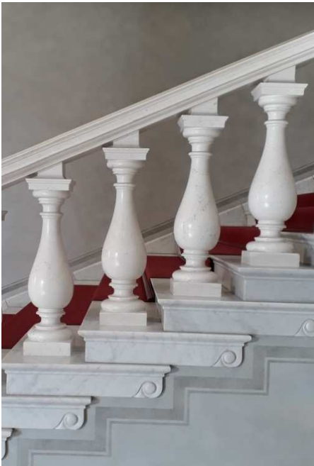
Ansicht Freiseite Stufen und Geländer