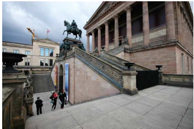
Reiterstandbild von Alexander Calandrelli. Es zeigt König Friedrich Wilhelm IV., den Ideengeber für das Museum Alte Nationalgalerie.

Treppenart: Verdoppelung einer dreiarmigen Treppe. Ein Treppenarm 28 Stufen. Stufen insgesamt 126. Die Treppenbreite: 5,20 m. Steigungsverhältnis: 14/36 cm.