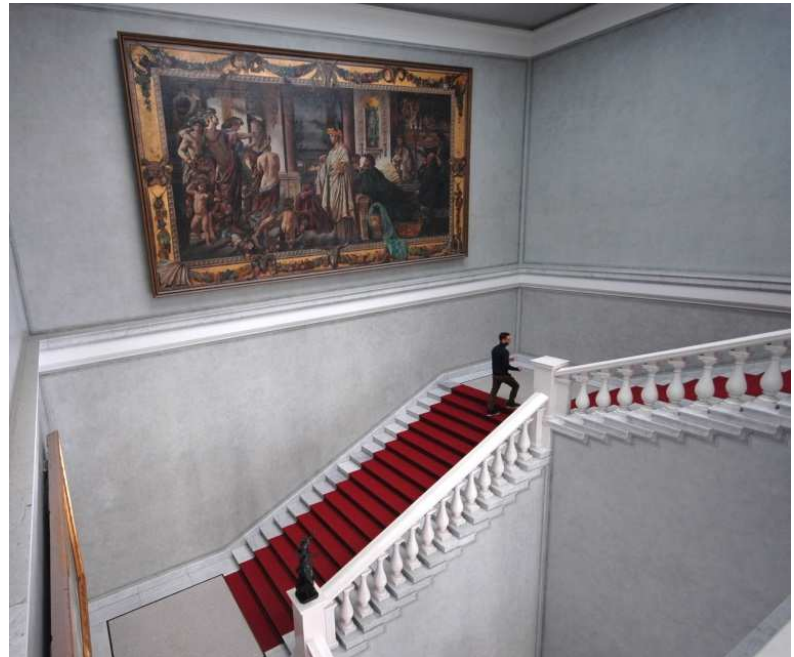
Treppe und Treppenraum zum zweiten Obergeschoß