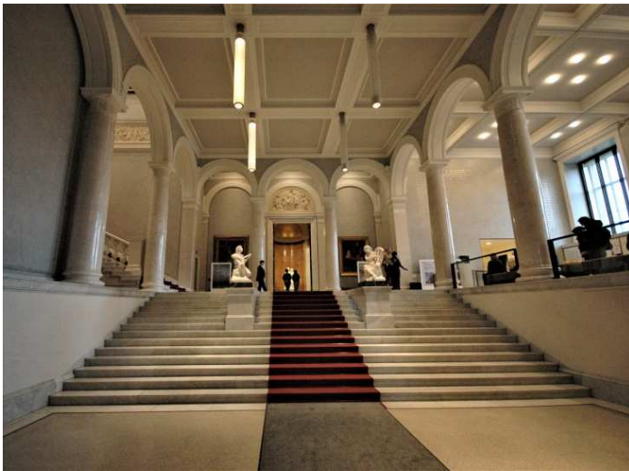
Eingangstreppe zum Vestibül

Ab 1992 wurden außen am Gebäude Restaurierungs- und Sanierungsarbeiten vorgenommen. Die Neugestaltung des Eingangsbereichs, der Einbau zweier Säle für die Werke von Caspar David Friedrich und Karl Friedrich Schinkel, sowie die Integration der nach heutigem Stand erforderlichen Haustechnik, waren die wichtigsten Aufgaben im Rahmen der Generalsanierung. 1998 schloss das Museum für die Arbeiten im Inneren des Gebäudes. Am 2. Dezember 2001 wurde die Alte Nationalgalerie wiedereröffnet.