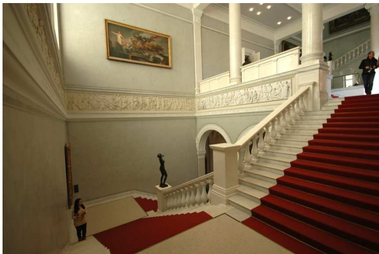
Treppe zum ersten Obergeschoss wurde im zweiten Weltkrieg zerstört und 1998 - 2001 wieder restauriert

Ab 1992 wurden außen am Gebäude Restaurierungs- und Sanierungsarbeiten vorgenommen. Die Neugestaltung des Eingangsbereichs, der Einbau zweier Säle für die Werke von Caspar David Friedrich und Karl Friedrich Schinkel, sowie die Integration der nach heutigem Stand erforderlichen Haustechnik, waren die wichtigsten Aufgaben im Rahmen der Generalsanierung. 1998 schloss das Museum für die Arbeiten im Inneren des Gebäudes. Am 2. Dezember 2001 wurde die Alte Nationalgalerie wiedereröffnet.